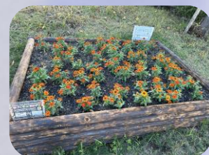
日吉小学校のみなさん が育てた花の苗

施設内には、studio FLAT所属アーティストによる作品を展示（NANOBIK1F）、花壇を設けて、地域ボランティア「さいわいふるさと公園」のみなさんといっしょに花の苗を植栽するなど、地域と一体になって、インクルーシブなSDGsに取り組んでいる。